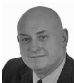
Hywel Williams Aelod Seneddol Etholaeth Arfon