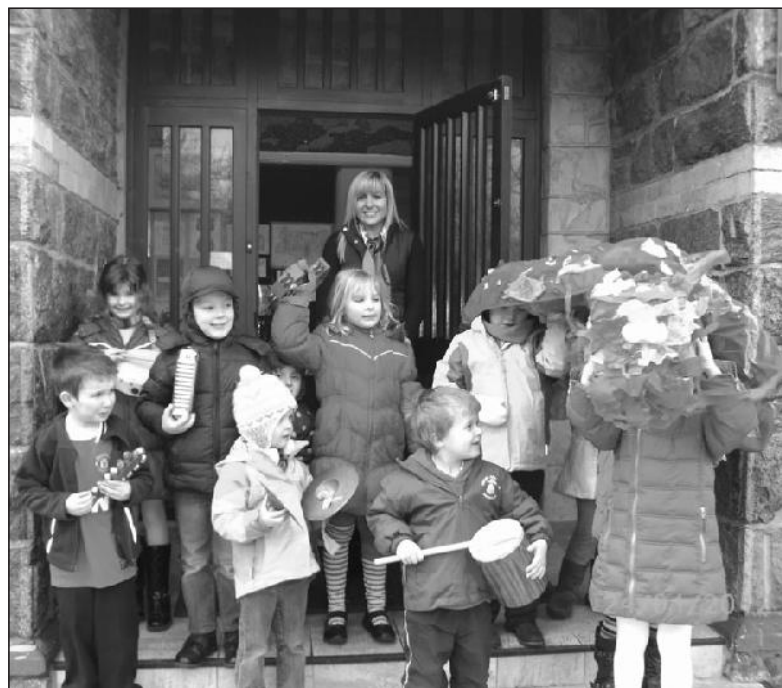
Dosbarth y babanod yn mynd â'r ddraig o amgylch pentref Rhiwlas